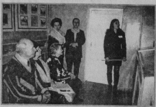
Члены клуба «ММХ» принимают участие в областном конкурсе «Семейный альбом», который будет проходить в апреле этого года.

Любовь к малой Родине, знание истории своего края — это те краеугольные камни, на которых строится фундамент нравственного воспитания подрастающего поколения. Именно они отдадут сейчас приоритетное направление педагогов и воспитателей г. Курлово. Сегодня рассказ о том, как они это делают.