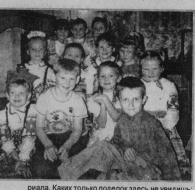
Ками только подросли, но уже увидели, как играть, паяно из досок, аппликация и т.д. Педагог учит составлять сюжетные выставки, например, по сказкам «Белоснежка и гномы», «Курочка, где сидит петух».

Этот детский сад — необычен. Водичка как в старинную деревянную яму. Группы — как горницы: светит разноцветными поддонами, вышитыми, самых различных видов рушниками. Коллектив детского сада № 3 г. Курлово выбрал приоритетным направлением воспитания детей — художественно-эстетическое развитие. Это не случайно. Дело в том, что коллектив воспитателей, все с желанием слушают и разучивают новые народные песни.