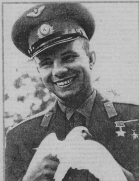
Герман Титов, летчик-космонавт.

«Мы берем границу в связи своей любовью к Юрию Гагарину, замечательному изобретателю человека. Он вошел в нашу жизнь как человек доброй и красивой души, твердой воли и большой скромности. Покорение космоса стало делом нашей жизни, и всякий раз, когда отправляемся на космические траектории, мы берем с собой светлый образ Юрия Гагарина, авла пример мужества, отваги, верности более людей России».