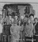
Волонтеры в Курлово

Вместе с нами в Курлово, в составе группы очень добродетельные, деловитые люди. К ним дети американцы