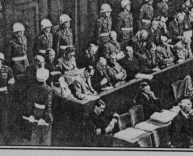
Военный предоступили на скамье подсудимых