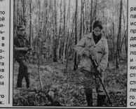
ВАС ЖДЕТ «ПОИСК»