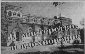
Навигация Музейно-образовательного Центра музея хрустальной посуды в Зубово-Удальском.

— Викторина Викторина, чем знаменатель был для коллектива прошедший год? — Его началом было знаменательно приездом в город Президента России В.Путина. Он был ораван музыкальным творением гусевских мастеров. В книге остался составленный запись: «Уникальный музей, уникальные люди».