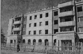
по ул. Куровской и Чайковского, новый станок по ул. Полевой. Рост ленточного транспорта увеличивает спрос на автовокзалы. По словам существующих в ближайшее время добавится по ул. Куровской и Транспортной. Проектируют жилой микрорайон на пересечении ул. Калинин и Теллицкого проспекта из 5-, 9-этажных домов, новые ленточные по ул. Транспортной, Демоскопская, Коммунистическая, Мемориала 2-ой Нарядной, Теллицкому проспекту, маяжмы по ул. Куровской и Транспортной, новые станки по ул. Пролетарской, Теллицкому проспекту и проспекту 50 лет Советской власти.

Восемь поселенцев активно строятся. Все, что зимой заготовлено - реализуется в жизнь. На исключение - строительство. Завершается строительство 9-этажного дома по Теллицкому проспекту и 5-этажного 72-квартирного дома по ул. К. Маркса. Продолжается строительство КНС по ул. Красноармейской. И наиболее активно идет строительство в районе «Горского-Бытового» обслуживания по улицам Славянов, Оружейной, Калинин (у теплотрассы), Васильева, на Теллицком проспекте. Муниципальное предприятие и на территории Большеного города.