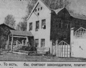
Здание МКП-2.

бы отныне заботились, платили по факту. Но нет смысла на воду, газ, тепло и так далее. Оплату по-прежнему брать на себя не может. Этот вопрос отложен до 1 января 2005 года, и results его будут решать.