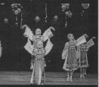
Танец младшей группы детского хореографического центра «Хрустальные грани».