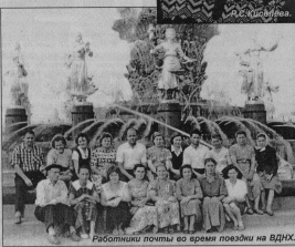
Работники почты во время поездки на ВДНХ.