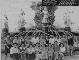
Работники почты на время поездки на ВДНХ.