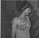
Показ моделей (рук. В.Павлов)

АНАШКИНА, главный специалист отдела образования. На снимках А. ЗУБАЧОВА: на празднике лето в ГИЦД (Иван) окончание представления.