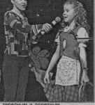
тересны и полезны.

Длгой насыщенный разнообразными мероприятиями: оздоровительная гимнастика, прогулки в лес, посещение кинотеатра «Атлант». Проведено много спортивных состязаний: «Веселые старты», «Сильные, ловкие, смелые», переноска по футболу, баскетболу, различные эстафеты, конкурсы народных игр и много другое. Не забыли поощрить Правды дорослого движения и поощрили беззаботности, проведенные соревнования «Беззаботное лето», викторины «Светофор», конкурс рисунков на прогимназическую тему, викторины «Сюны - дру и вра». В лагерной жизни нашли отражение и знаменательные события страны: «Я - это за красноту, эти словами ко дню рождения А. С. Пушкина, «Россия - Родина моя» - во Дню независимости, мероприятия, посвященные Дню памяти - 22 июня (конкурс содательской песни, митинг «Юрид мира, на минуту встанте», конкурс рисунков «Детям нужен мир», «Я рисую мир») и другие. Все оздоровительные лагеря объединяет общая цель - сделать отдых детей интересным.