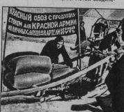
КАСЯНИН ОБОЗ СПЕЦИАЛЬНОЕ РАЙОНА КРАСНОГО АРМИИ