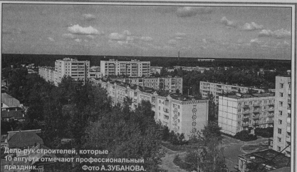
Допе-рук-строителей, которые 10 августа отмечают профессиональный праздник.