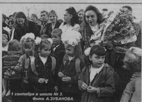
1 сентября в школе № 3.

Средоветов области, города, района Доверчивые люди в Москве Как избавиться от дурных привычек Затопки на зиму Суперсканворд Реклама. Объявления