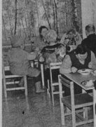
На отделении дневного пребывания в центре социального обслуживания.