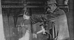
Уважаемая работница ЗАО «Армагус», ООО «Гусевский арматурный завод», ООО «Штапельмехмаш»!

Сегодня поздравляю вас с профессиональным праздником - Днем машиностроителя. Ваша продукция сегодня находит свое применение практически во всех районах нашей страны. Желаем вам крепкого здоровья, успехов, счастья и благополучия в семье, новым трудовым достижениям и свершениям, прекрасной насроности!