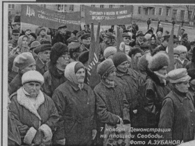
7 ноября. Демонстрация на площади Свободы.

Чему научат в УК «Хрустальный» Компьютерный центр в колледже Талантливая певица из п. Гусевского Памятные даты России Телепрограмма Реклама. Объявления