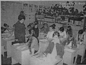
Во всех школах города и района наступила ответственная пора: со всеми немалым старанием, до конца октября четверти. А впереди такой прекрасной праздник - Новый год. Пришлите нам в газету поздравления для своих родных и друзей!