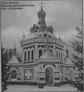
Храм-часовня Вувары-епитимучиним.