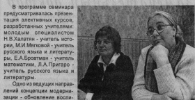
Участники семинара в актовом зале школы.

Запланированы открытые уроки, предложенная участникам семинара, показала, что реализация основных направлений модернизации осуществляется непрерывно и определяется следующими задачами: содержание образования, способы, примененные современные технологии обучения; формирование личности, которые способствуют воз-