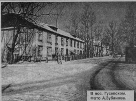
В пос. Гусьевском.

в 11 часов 5 минут поступил звонок из здания УВД № 2 о задержании в здании взрывном устройстве. На место происшествия тут же была направлена следственно-оперативная группа. В ходе проведенного осмотра взрывное устройство сотрудниками милиции обнаружено не было. А розыскными мероприятиями в здании обнаружены следы «небольшого терроризма». Им оказался ушедший школьник 14 лет, которому в ящике иномашины, др. детек-