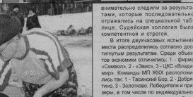
Оказание медицинской помощи.

Команды перешли от этапа к этапу: надевали противогазы, защитные костюмы, устранились на трубопроводах (коммунальщикам), подавали пожарные стволы первой помощью, оказывали первую медицинскую помощь. Соревновались с настраиванием и