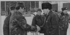
Приниматели участников.

Всемирный день гражданской обороны, 1 марта, в нашем районе был отмечен традиционными соревнованиями формированиями промышленных предприятий и МП ЖКХ. На базе Куровского муниципального предприятия собрались 6 заводских команд и 5 коммунальной аму территории.