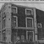
Здание горэлектросети

Важные проблемы у нас одна - вопрос. Но новая компания обещает привести деньги в наш город.