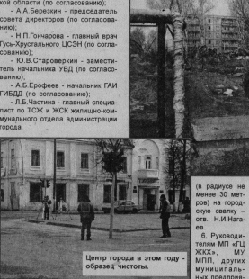
Центр города в этом году - образец чистоты.