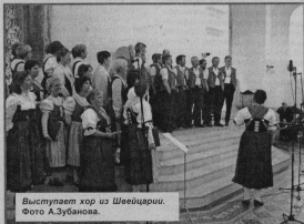
Выступает хор из Швейцарии.

В эти дни облетают территории клубов и цветники, пострижены кусты.