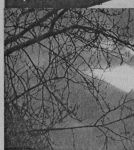
так бесплодны по отношению к своим детям, внукам, правнукам...