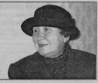
тия С.А.Копылова, за творческий потенциал всех участников спектакля и танцевального коллектива под руководством Г.А.Титовой, и всем тем, кто оказал посильную помощь. Пусть и в дальнейшем уделяется больше внимания проведению подобных мероприятий. А.СМОЛОВА, учитель Воеводской школы

Хотелось бы сказать большое спасибо за организацию проведения праздника Н.П.Королевой, за предоставленную возможность для проведения мероприя-