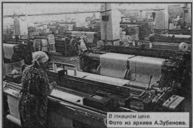
В плавильном цехе.

Семас у текстильщиках есть трудность с приобретением сырья, но все находят, что они временные. Коллектив ОАО «Гусь-Хрустальной текстильной компании» всегда отличался квалифицированными и ответственными работниками. Сегодня, в тану Дн работникам легкой промышленности, на комбинате пройдет торжественное собрание, где будут подведены итоги экономического соревнования. Как в старые