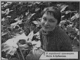
В городской оркестре.