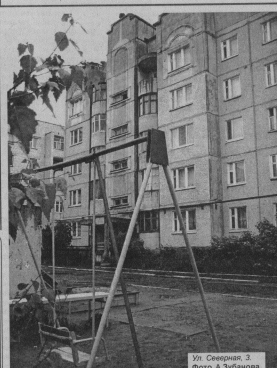
Ул. Северная, 3.