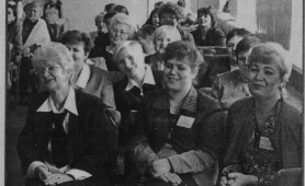
В СШ № 15 идет семинар учителей.