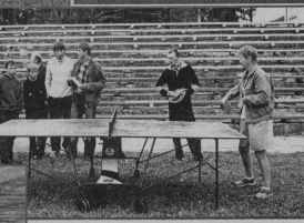
На теннисном корте.