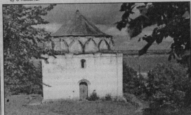
КУПОН УЧАСТНИКА XXVII ТУРА в ГУСВЕСИХ № 94 от 25.08