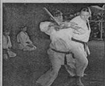
выслушивают новые каратисты.

Не первый год в спортивном лагере им. А.В. Лавина в летний период работает детский оздоровительный лагерь. Здесь отдыхают ребята, которые записаны в секции карата. В течение лагерной смены мальчиш-