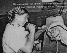
На снимках: на уроке математики в старейшем училище ЮА. Белоярского