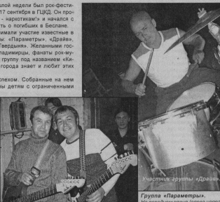
Участники группы «Драйв».