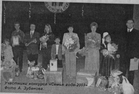
Участники конкурса «Семья года-2003».

Для участия в конкурсе необходимо подать заявку и представление в отдел по проблемам семьи, молодежи и детей, отдел по делам молодежи администрации го-