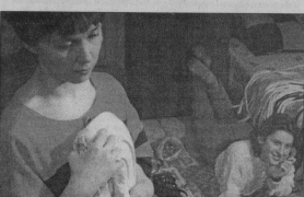
Материалы подготовлены Т. БОРИСОВОЙ, психологом поликлиники МУЗ № 1.

В данном случае действовать надо по нескольким направлениям: 1. Сопоставить перед зеркалом и мысленно оценить себя. Сделайте это в максимальной доброжелательности. Назовите свои недостатки, например: «Я очень робко в новой компании». Затем охарактеризуйте