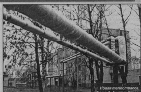
Новая теплотрасса, фото А. Александрова.

С. ПОГОРЕЛОВ, помощник военного комиссара по информационной работе.