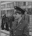
Тренировочный процесс на маршевом грде для молодых призывников в городе.

Увеличивается процент больных и инвалидов в службе. Более 15% юношей, прибывающих на службу в комиссию, направляются на амбулаторию и стационарное обследование.