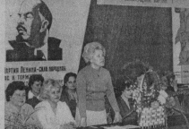
Отчетно-выборная профсоюзная конференция.

мест с 700 до 2200. Но вскоре ряды были перенасыщены, и пришлось сокращать на склад, себе в убыток. С начала перестройки предприятие оказалось банкротом. Рабочие оказались за воротами, стальные цеха опустели, умолкли станы.