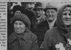
«Мн. прибавился в защите от пенальти»

Что касается обеспечения населения льготными лекарствами, то 10 января 2006 года отделение Пенсионного фонда по Владимирской области передало письмо, информирующее право на получение льготных медика-