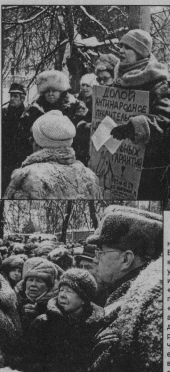
Патлыма-ка гульво в Сепулю Гусь.

Мне этот митинг напомнил строки А.Блока в поэме «Двенадцать». Завоевал ветер Белый снежок. Где синижко - лебко. И здесь, как в поэме, вития (поэт) читает: «Предатели! Поблуда России». А рядом - их современники: «А сделаем революцию