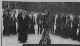
граммами прошли посвящение.

В декаду поющих людей без внимания не остался ни один ветеран. Чаепития с концертными про-