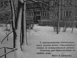
С наступлением отопительного сезона резко повышается плата за коммунальные услуги. Поэтому уже давно succeeds не любят жить.