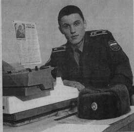
Тот жив, кто Отчизну спасает! (Чемпионка чемпи)

В Гусевских вестях (на 12 от 18 февраля) на 1 стр. из текста Постановления главы администрации города по техническим причинам выпали номер постановления и дата - № 54 от 16.02.2005 года.