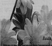
Составлено по материалам газеты «Мещера» и сайта Интернет Российской партии ЖИЗНИ