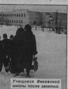
Училище Векоской школы после закрытия.