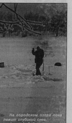
На городском озере пока лещат глубокий снег.

Управлению ветеринарии администрации области предписано принять необходимые меры по устранению недостатков. До 1 апреля т.г. в управление ветеринарии должны быть ликвидированы ветеринарные учреждения, не имеющие лицензии. Кроме того, в постановлении содержится указание усилить работу по недопущению распространения возбудителей особо опасных заболеваний при ввозе скота, мяса, продуктов и сырья из-за рубежа. Пресс-служба администрации области.