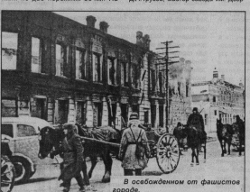
В освобожденном от фашистов городе.