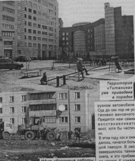
Территория «Титаника» уже преобразована в парковку

В городе много заросших парков скверов, в частности парк стелевой линии Дервижского. На Жилучастье — работы непочатый