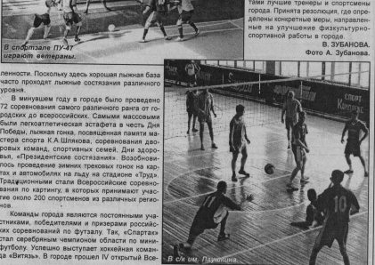
В спартакиаде ПУ-47 участвуют ветераны.

ленности. Поскольку здесь хорошая лыжная база часто проходят лыжные состязания различного уровня.