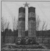
Памятник на возвышении с Великой Отечественной войны в д. Черское.