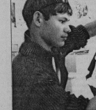
На занятиях по рисунку

Выпялка свое творчеством началось внутренне - в театральные мюзиклы, праздничных представлениях в арии и в их дети чувствуют себя как дома. Это их мир, любимая творческая среда.