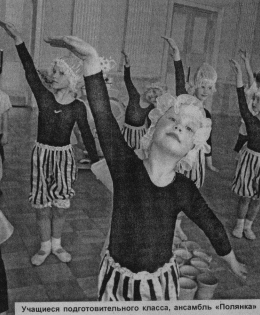
Учащиеся подготовительного класса, ансамбль «Полянка»

- В сентябре прошлого года ДШИ представлены на областной выставке, посвященной юбилею Победы.