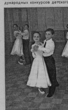
Ансамбль балльного танца

Ребята с удовольствием участвуют в традиционных школьных конкурсах детского изобразительного творчества. Они ежегодно проводятся на художественном отделении. Юные тандреры два раза в год показывают профессиональ-