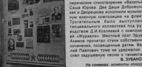
На снимках: моменты конкурсов.

еще летом 1940 году. К концу этого года был утвержден план войны против СССР, получивший название «Барбаросса». Гитлер рассчитывал быстро закончить войну. Он не сомневался в своей победе. Намечалось нанесение мощного удара по основным силам Красной армии, уничтожить их и захватить Москву. Но война длилась четыре страшных года, 1418 дней и ночей. Это была высшая цена, народная война.