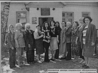
Коллектив центра социального обслуживания населения.

Совет ветеранов пос. Англино (председатель Н.В.Седокова) стал победителем в области сотрудничества первичных организаций, посвященном 60-летию Великой Победы, награжден дипломом, денежной премией в размере пяти тысяч рублей.