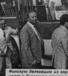
Фиску делегацию из города-победителя Рихимики встречали в Гусевском стальной колледже.