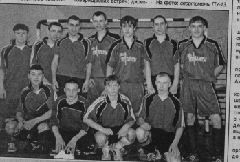
На фото: спортсмены ПУ-13.

О. ВАЛЕНТИНОВА. На фото: спортсмены ПУ-13.