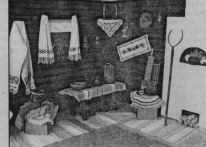
Музей в школе 0.Зубова.

На реализацию регионального компонента в школах области будет выделяться от полтора часа в неделю в начальных классах до 3-х часов — в 9-м классе.