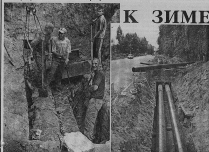
Ремонтные работы на ул. Октябрьской ведут Северный участок «Промонтаж». Работает бригада А.Е. Анисимова.