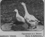
Геральтика из с. Вилки.