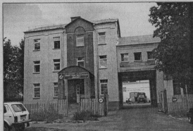
Административное здание треста

В целях получения прочей прибыли в тресте создан строитель-