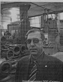
Новая «машина» ООО «Гусарь».